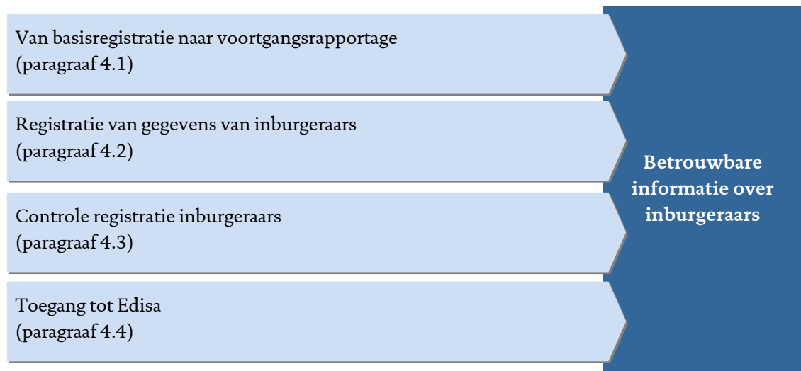
Figuur 4.1 - Toetsaspecten risico's betrouwbaarheid

De rekenkamer onderzocht aan de van de volgende toetsaspecten in hoeverre er risico's bestaan voor betrouwbare informatie over inburgering.