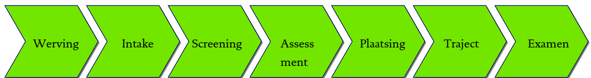
Figuur 2.2 - Processtappen inburgering

De gemeente Amsterdam wijzigde de organisatie van deze stappen per 1 maart 2010. Omdat dit rekenkameronderzoek zich richt op de kwaliteit van de informatievoorziening over inburgering aan de raad in de periode 2007-2010, gaan we in dit rapport nog uit van het oude inburgeringsproces. Hieronder geeft de rekenkamer een overzicht van de onderscheiden processtappen in de oude situatie van vóór maart 2010.